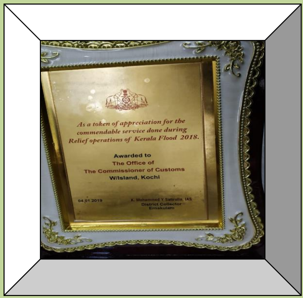
कोचीन सीमाशुल्क समाचार पत्रिका